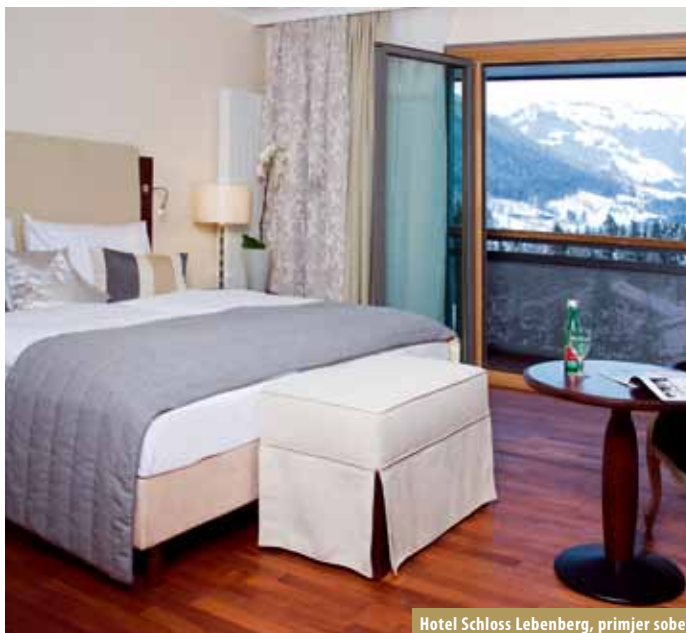
Hotel Schloss Leobenberg, primjer sobe