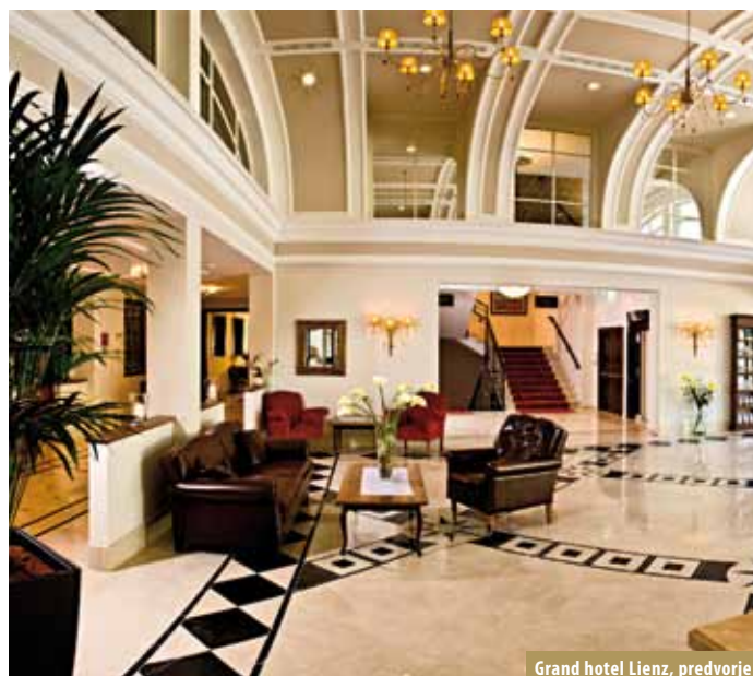
Grand hotel Lienz, predvorje

Položaj: u istočnom Tirolu, od 686 do 2278 m/nmv; skijalište Lienzer Dolomiten: Zetttersfeld i Hochstein