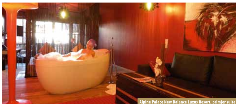
Alpine Palace New Balance Luxus Resort, primjer suite