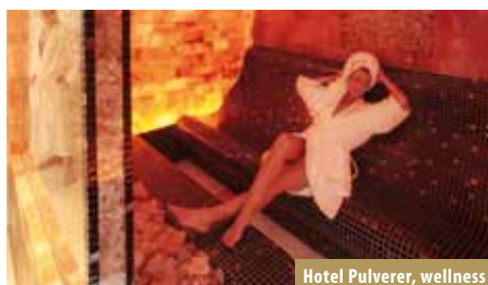
Hotel Pulverer, wellness

Položaj: u Koruškoj, 1100 m/nmv Sportska ponuda: 2 prirodna klizališta, 2 sanjkališta, kuglanje na ledu - curling, jahanje, dvorana za tenis i squash, toplice s bazenima u 2 zatvorene dvorane, bazen na otvorenom (26°C), saune, masaže, solarij, trim kabinet Pristup/udaljenost: Ljubljana - tunel Karavanke - Villach - Radenthein - Bad Kleinkirchheim; od Zagreba 285 km