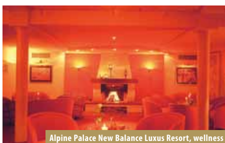
Alpine Palace New Balance Luxus Resort, wellness

Položaj: u Tiroli; 800 m/nmv, poznato po najslavnijoj i najtežoj spust stazi Svjetskog kupa Hahnenkamm