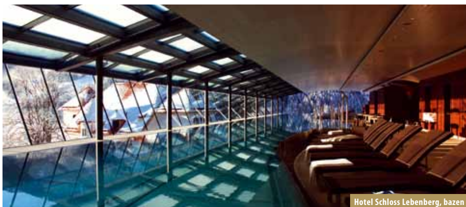
Hotel Schloss Leobenberg, bazen