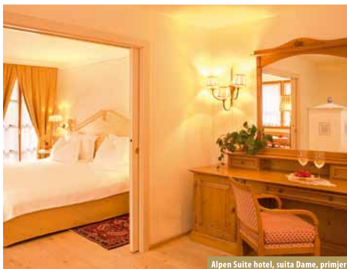
Alpen Suite hotel, suita Dame, primjer