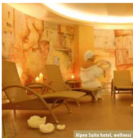
Alpen Suite hotel, wellness