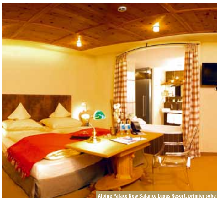
Alpine Palace New Balance Luxus Resort, primjer sobe