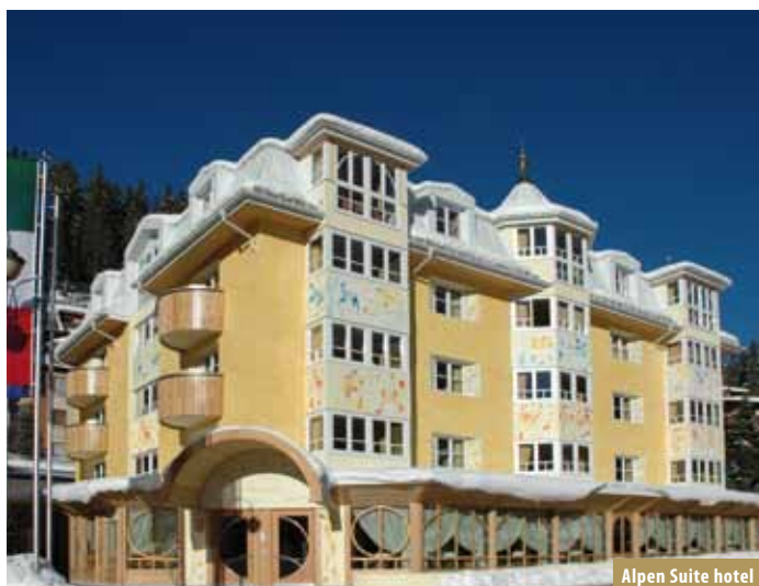
Alpen Suite hotel