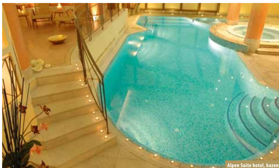
Alpen Suite hotel, bazen

Položaj: na 1550 m/nmv Sportska ponuda: klizalište, bazen, škole skijanja, skijaški vrtić za djecu Pristup: Ljubljana - Fernetiči - Venecija - smjer Padova - Trento - izlaz Doganale - Bolzano/ Brennero - izlaz San Michele/Mezzocorona - Mezzolombardo - Mostizzolo - Dimaro - Tonale - Madonna di Campiglio; od Zagreba 604 km