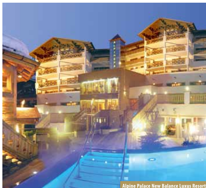
Alpine Palace New Balance Luxus Resort