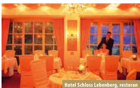
Hotel Schloss Leobenberg, restoran