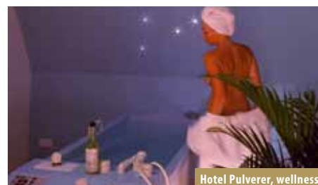
Hotel Pulverer, wellness