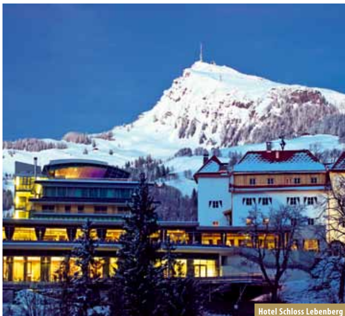
Hotel Schloss Leobenberg