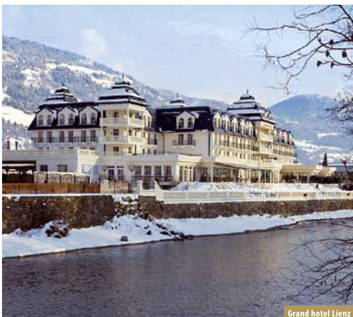
Grand hotel Lienz