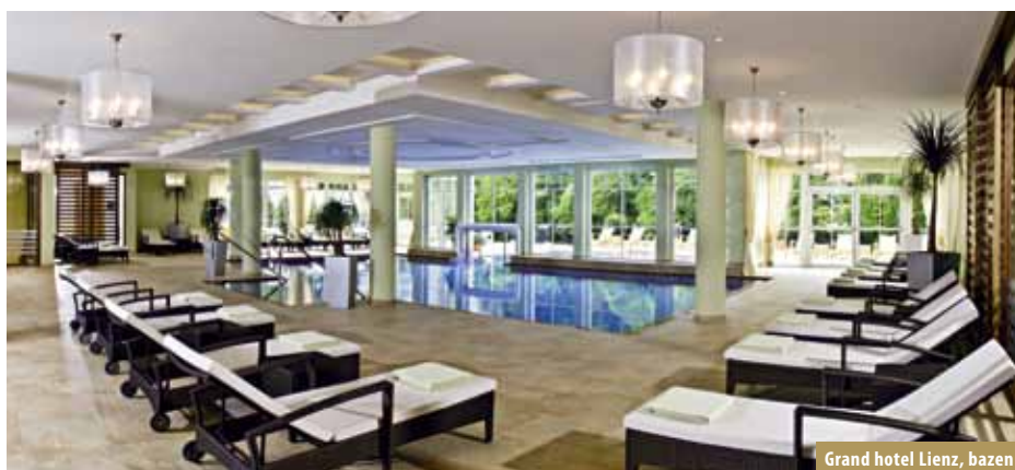
Grand hotel Lienz, bazen

Prehrana: buffet doručak, večera (uz doplatu) meni u pet sljedova ili buffet večera