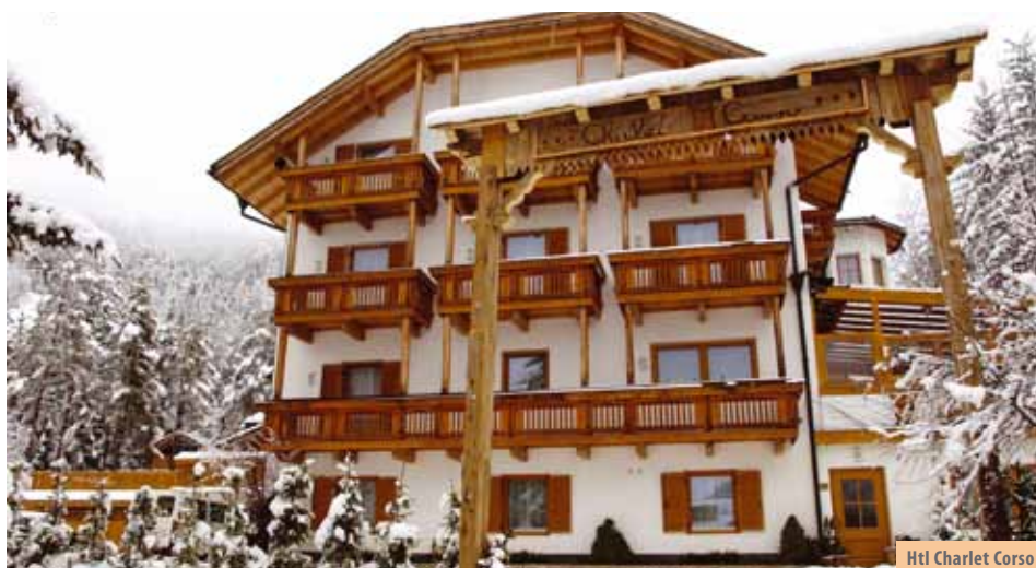
Htl Charlet Corso