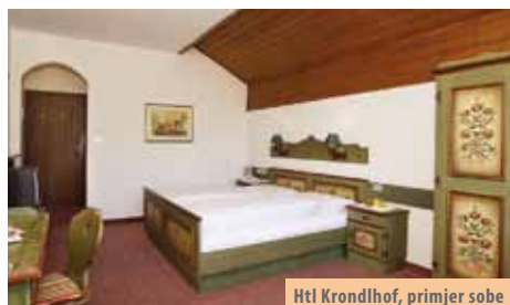
Htl Krondlhof, primjer sobe