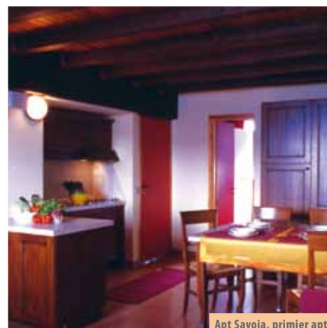
Apt Savoia, primjer apt