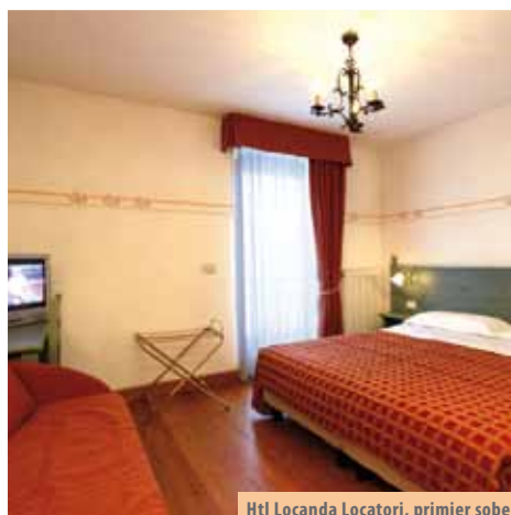
Htl Locanda Locatori, primjer sobe

Boravišna pristojba uključena je u cijenu.