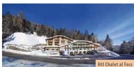
Htl Chalet al Foss