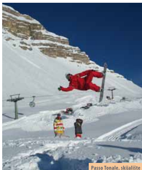
Passo Tonale, skijalište