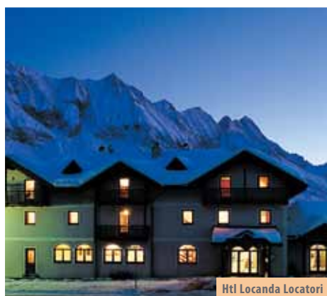
Htl Locanda Locatori

Boravišna pristojba uključena je u cijenu.