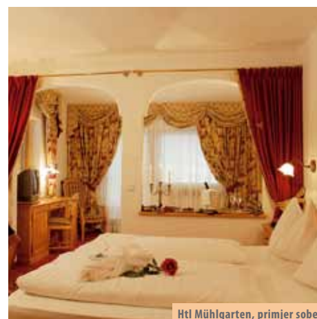
Htl Mühlgarten, primjer sobe