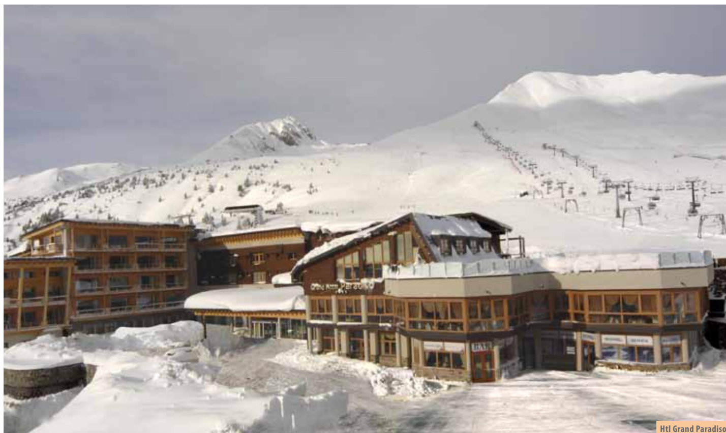
Htl Grand Paradiso