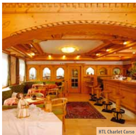
HTL Charlet Corso

1/6-8 apt: 110 m 2 , spavaća soba s bračnim ležajem, spavaća soba s 2 kreveta na kat, dnevna soba, 2 kupaonice