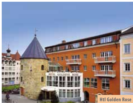
Htl Golden Rose

Prehrana: kontinentalni ili buffet doručak