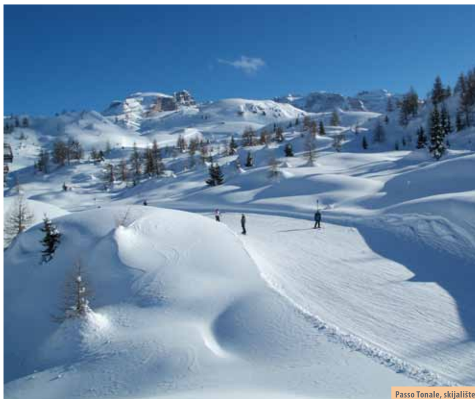
Passo Tonale, skijalište