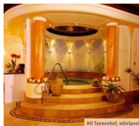
Htl Tannenhof, whirlpool