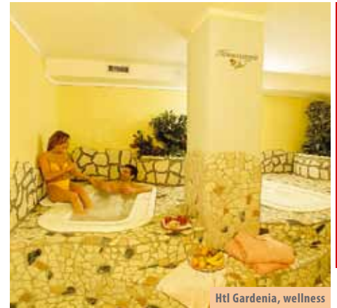
Htl Gardenia, wellness