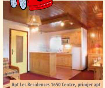
Apt Les Residences 1650 Centre, primjer apt