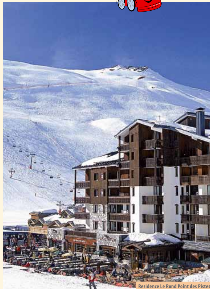
Residence Le Rond Point des Pistes

1/7-8 trosobni: dnevno spavaća soba s dva kreveta, spavaća soba sa dva kreveta, mezzanin s četiri kreveta