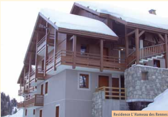
Residence L' Hameau des Rennes

Položaj: smještena na vrhu naselja, 80 m od skijaških staza, 300 m od trgovačkog centra 1/10 trosobni dvoetažni chalet: 72 m 2 , kuhinja (štednjak, hladnjak, mini pećnica, perilica posuđa, aparat za kavu), dnevno spavaća soba s ležajem za dvije osobe ili dva odvojena kreveta, TV, balkon/terasa, 1. kat – spavaća soba s bračnim krevetom, spavaća soba s krevetom na kat, kupaonica, 2. kat – spavaća soba s dva ili tri kreveta, kut s jednim ili dva kreveta, kupaonica