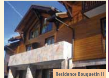
Residence Bouquetin II

Položaj: na 1650 m/nmv Sportska ponuda: hodanje na krpljama, najam skija i skijaške opreme, ski i snowboard škola, klizalište Pristup/udaljenost: Ljubljana - Fernetiči - Trst - Torino - Briancon - Vars; od Zagreba 920 km