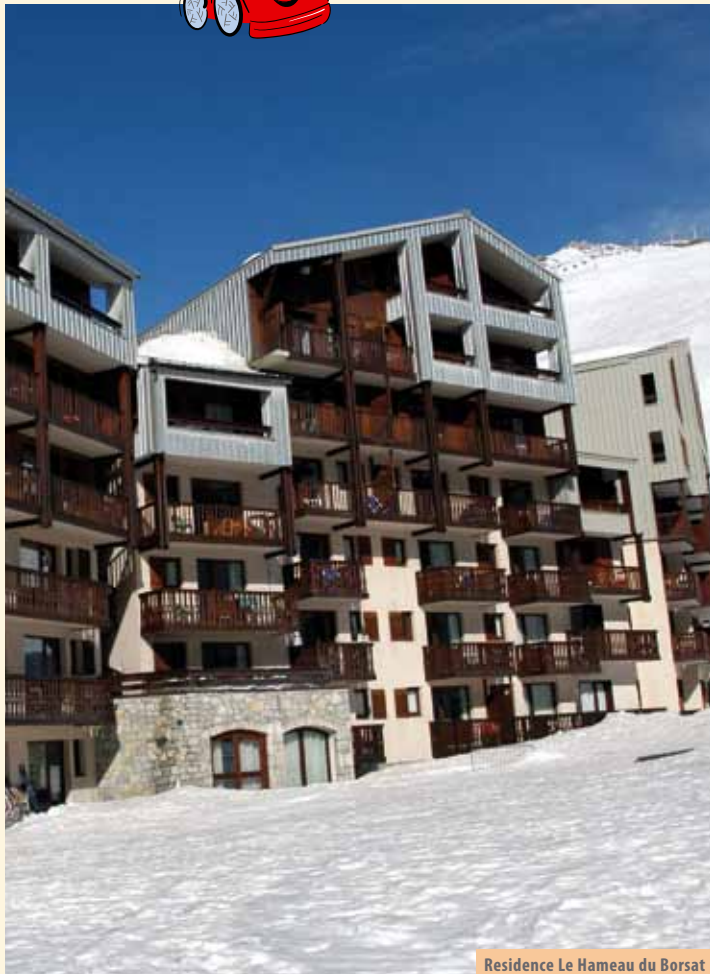
Residence Le Hameau du Borsat

Autobusni prijevoz iz Zagreba, Rijeke, Ljubljane, Osijeka, Sl. Broda, Splita, Zadra, Varaždina, Pule: cijena naknadno