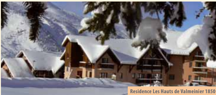
Residence Les Hauts de Valmeinier 1850