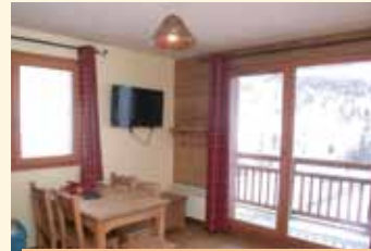
Residence L' Hameau des Rennes, primjer apt