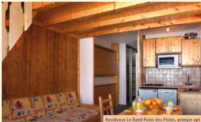
Residence Le Rond Point des Pistes, primjer apt