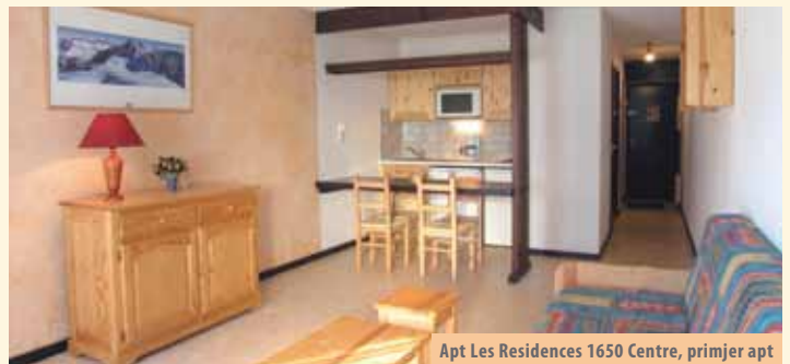
Apt Les Residences 1650 Centre, primjer apt