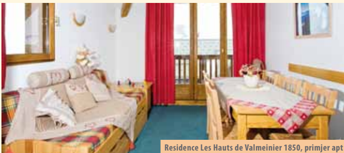
Residence Les Hauts de Valmeinier 1850, primjer apt