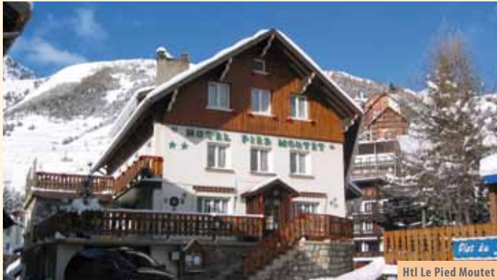
Htl Le Pied Moutet