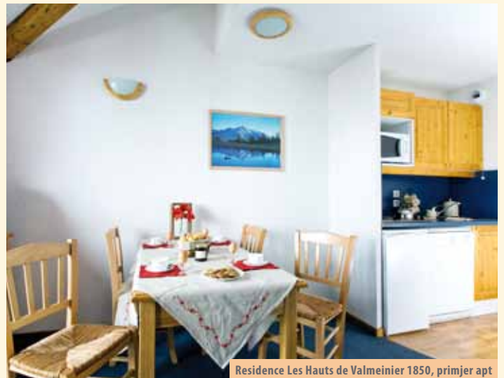
Residence Les Hauts de Valmeinier 1850, primjer apt