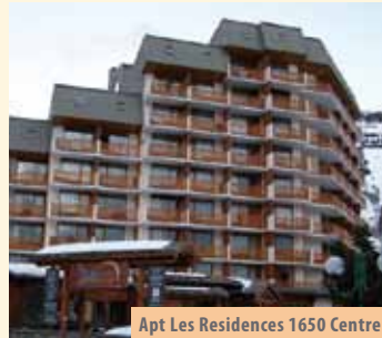
Apt Les Residences 1650 Centre