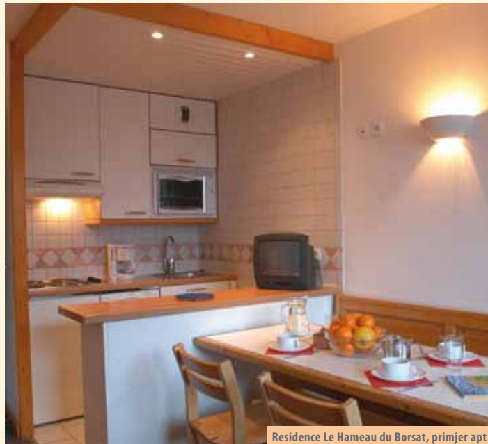
Residence Le Hameau du Borsat, primjer apt