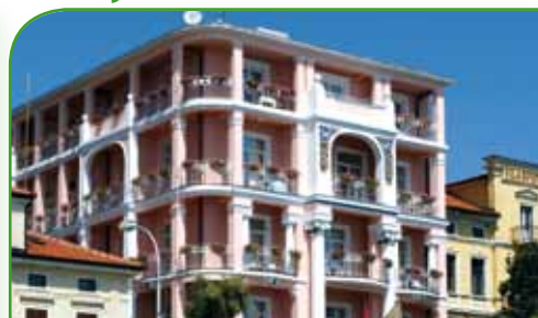
Hotel MOZART 5* polupansion / osoba / kn