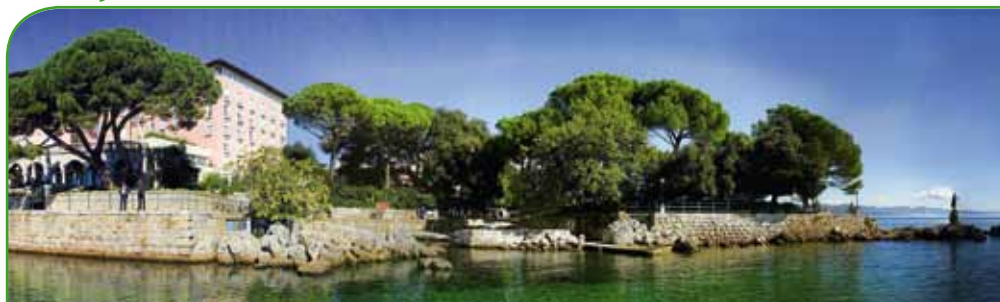
HOTEL MILENIJ 5* noćenje s doručkom / osoba / kn