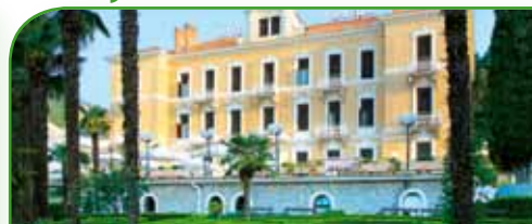
Hotel OPATIJA 2* polupansion / osoba / kn