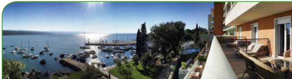
GRAND HOTEL 4 OPATIJSKA CVIJETA 4* HOTEL AGAVA 4* polupansion / osoba / kn