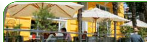
Hotel BRISTOL 4* polupansion / osoba / kn